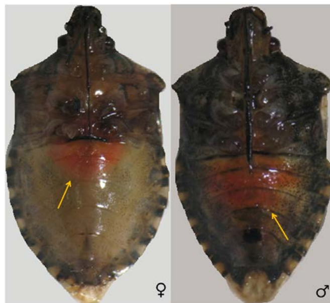
Figure 2. Coloration of sternum in female and male brown marbled stink bug

temperatura i dužina dana tj. fotoperiod (dugi fotoperiod stimulira razvoj crvenog pigmenta, a kratki ga potiskuje) (Niva i Takeda, 2002; Niva i Takeda, 2003). Pod utjecajem fotoperioda također se mijenja pigmentacija pronotuma, veličina tijela, učestalost hranjenja, brzina razvoja te nakupljanje lipida kod ličinki petog stadija vrste H. halys (Niva i Takeda, 2003).